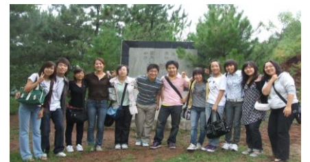
承德市の学生との交流

主催：柏市国際交流センター(KCC)指定管理者 NPO法人柏市国際交流協会(KIRA)