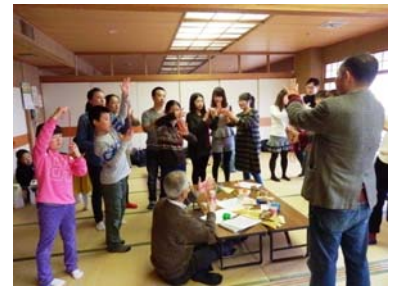
あやとりに夢中のみなさん

折り紙は、鶴・小物入れ・はし置き・飛行機などに皆でチャレンジ。家族・親子・友だち同士で参加した学習者は、スタッフとの和気あいあいとした時間の中で楽しく交流を深めることができましたようです。