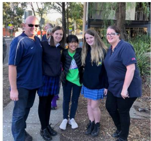
ホストファミリーと

このように、オーストラリアの医療には日本と似ている面があり、日本人にとっては比較的住みやすい国なのだと感じました。