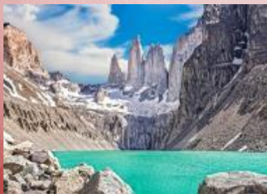
Three Towers & 氷河湖