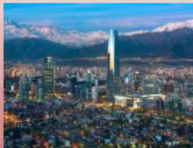
首都 サンティアゴ