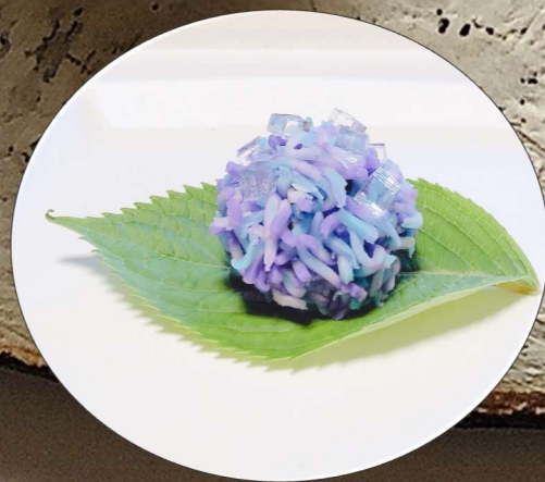
ね き 練り切り